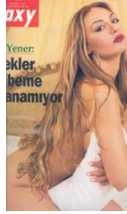
S. Galaxy, 18 Mart 2001, s. 1.