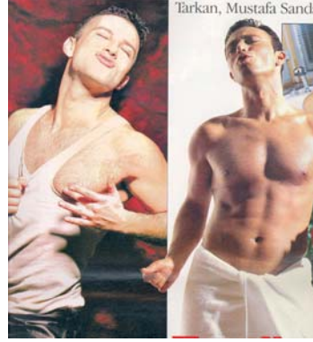
Şamdan, 17 Ağustos 2002, ss. 20-21.