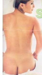
Süper Galaxy , 11 Mart 2001, s. 20.

Bu durum, Rojek’in (2003: 99) de vurguladığı üzere, “ünlülerin ya da ünlü olma uğraşındaki kişilerin kitleleri cezbetmek; ancak beraberinde, doyumsuz bırakmak üzere tasarladığı yoğun bir cinsellik sunumudur.” Bu kişilerin, “gerek verdikleri erotik pozlar